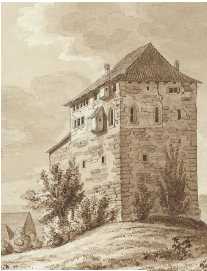
Zeichnung: Gebrüder Schulthess, um 1840